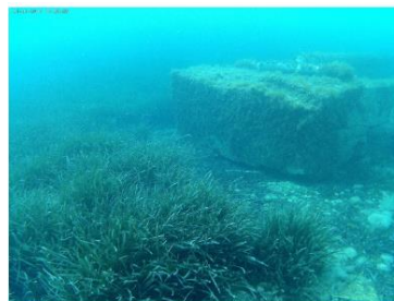
Herbier à Posidonies